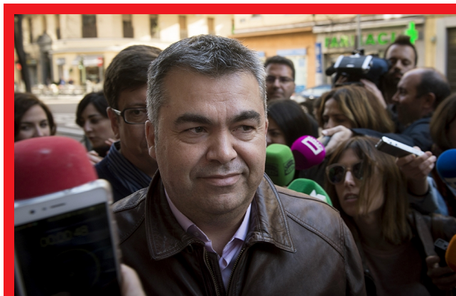
El socialista navarro, Santos Cerdán

El PSN-PSOE mantendrá su Proposición de Ley para equiparar las pensiones más bajas, entre ellas las de viudedad, al nuevo SMI, a pesar del informe negativo del Gobierno y de la petición de retirada por parte de Geroa Bai. Los socialistas señalan que el Gobierno solo se está moviendo por las presiones, entre otros del Partido Socialista, y va a mantener la ley para tratar de asegurar que se apruebe la subida por una vía o por otra.