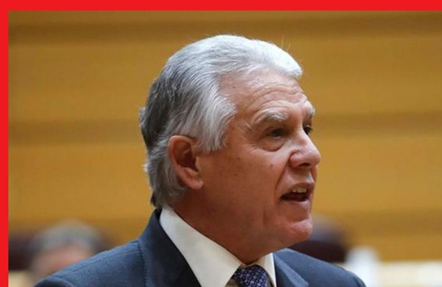
El portavoz del PSOE en Educación, Francisco Menacho

El portavoz del PSOE en Educación, Francisco Menacho ha criticado en el Senado "la falta de lealtad institucional del Gobierno con la comunidad educativa" por los recortes con los que la ha castigado los últimos cinco años. Menacho ha intervenido durante el debate sobre la necesidad de alcanzar un pacto educativo en la Comisión General de las Comunidades Autónomas de la Cámara Alta. Ante la oferta de pacto propuesta por el